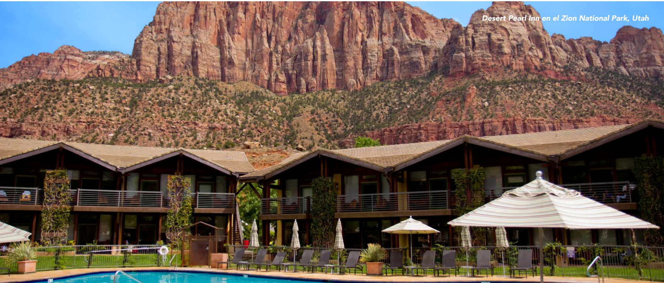
Desert Pearl Inn en el Zion National Park, Utah

Si buscas más inspiración e ideas para viajar por Estados Unidos, ingresa a: VisitTheUSA.com