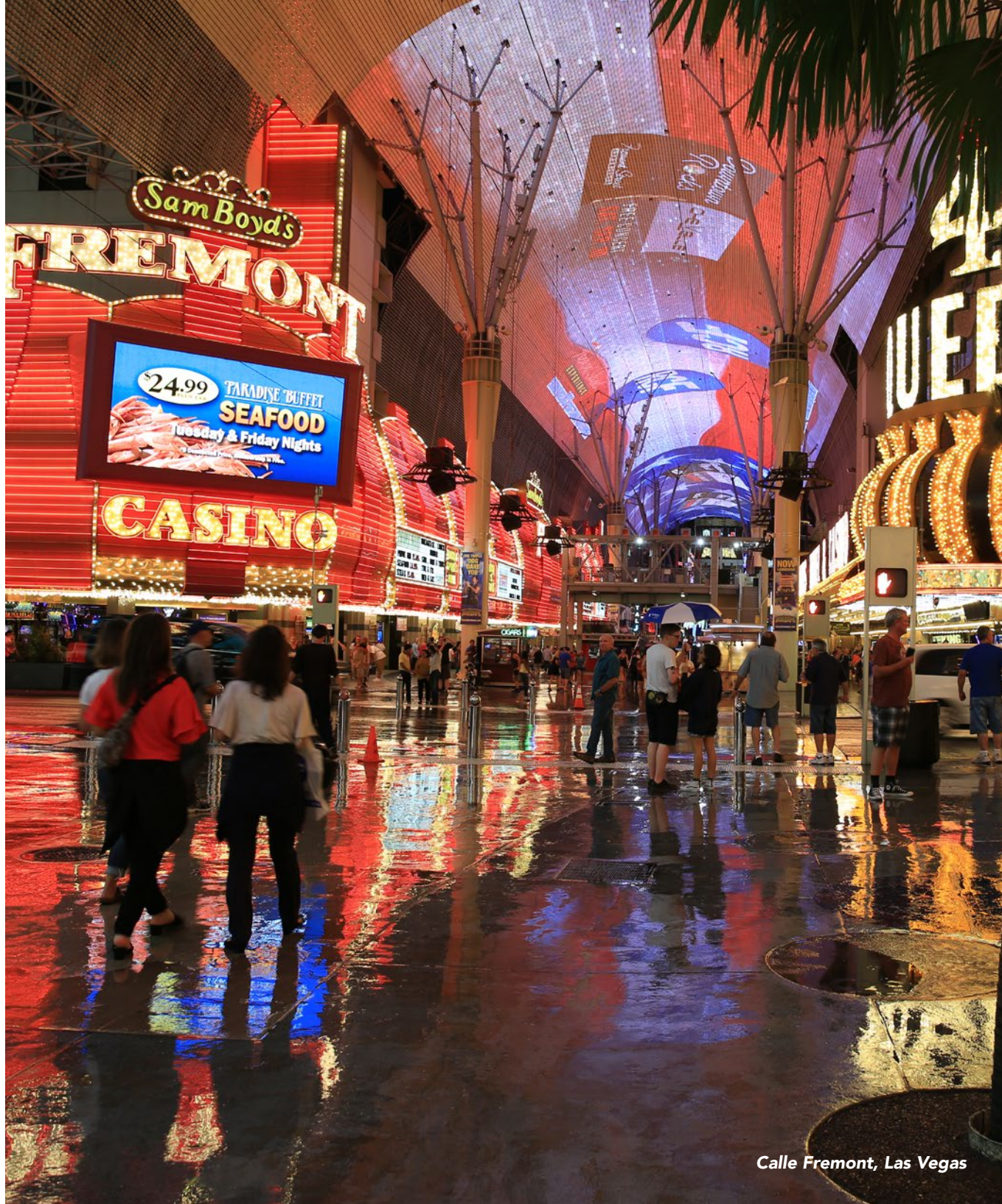
Calle Fremont, Las Vegas