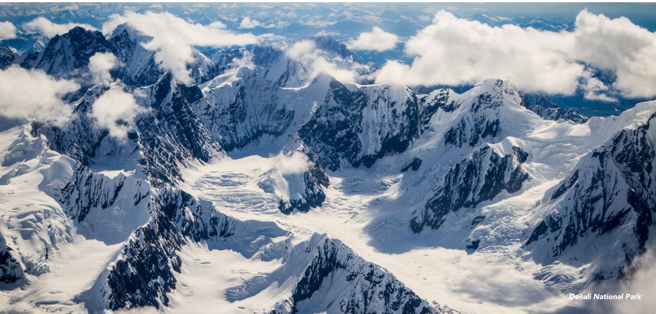
Denali National Park

Si buscas más inspiración e ideas para viajar por Estados Unidos, ingresa a: VisitTheUSA.com